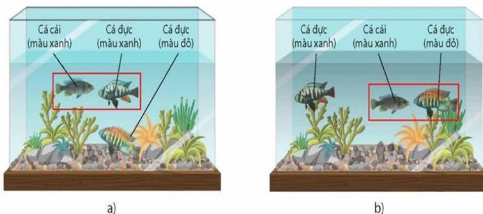
Hình 4 !. Thí nghiệm nuôi hai loài cá trong điều kiện ánh sáng bình thường (a) và điều kiện không có ánh sáng (b)

Câu 2: Ở hai loài cá cùng chi Hình 4 , các con cái có xu hướng chọn bạn tình dựa vào màu sắc của con ở ở thời kì sinh sản. Trong đó, con đực của loài Pundamilia pundamilia có lưng màu xanh nhạt còn con đực của loài Pundamilia nyererei có lưng màu đỏ nhạt. Khi nuôi các con đực và cái của hai loài này trong hai bể cá, kết quả cho thấy trong bể ở điều kiện có ánh sáng, cá cái chỉ giao phối với cá đực cùng loài, còn trong bể không có ánh sáng xảy ra hiện tượng cá cái giao phối với cá đực của loài khác.