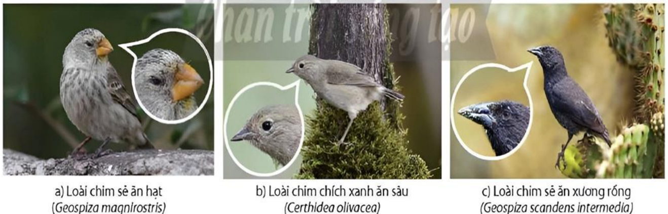
Hình 1: Ba trong số các loài chim sẻ trên đảo Galapagos được Darwin mô tả về sự thích nghi cấu tạo mỏ

Câu 1. Trên quần đảo Galapagos, Darwin nhận thấy các loài chim sẻ khác nhau trên hòn đảo về cơ bản là giống nhau nhưng vẫn có sự khác biệt về kích thước, mỏ và móng vuốt của chúng như Hình 1 . Xác định mỗi kết luận sau đây là đúng hay sai?